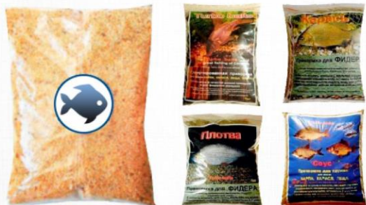
смеси для прикормки рыб